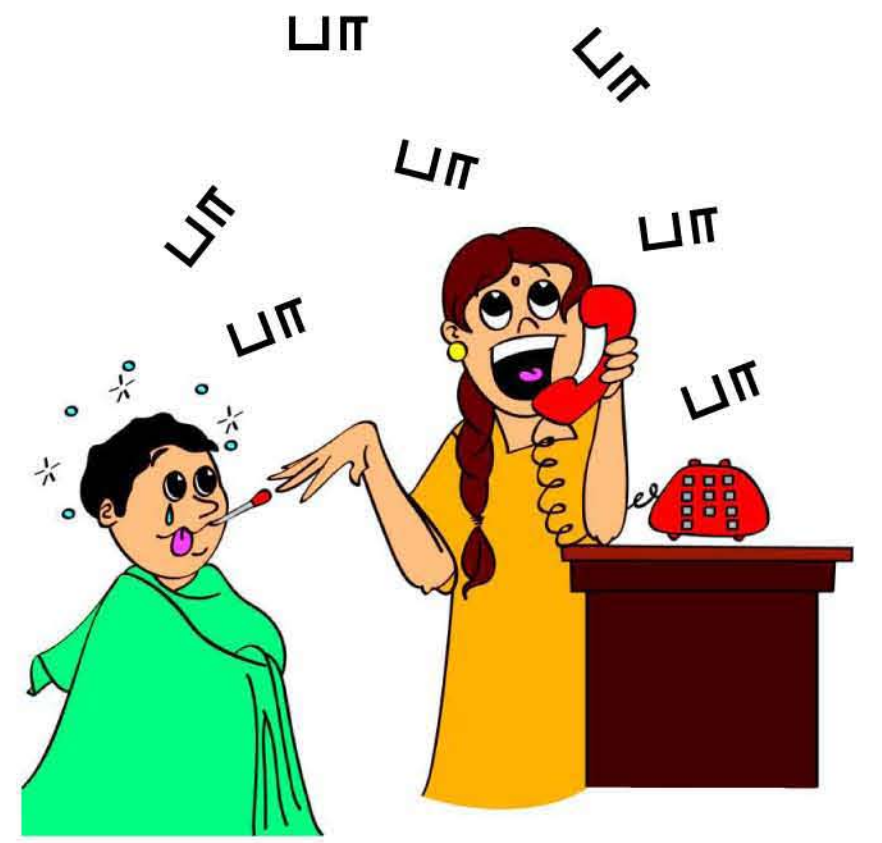
குழந்தையின் மருத்துவத் தேவையை நிறைவேற்றாமல் இருப்பது

குழந்தைக்கு குழப்பம், பாதுகாப்பற்ற உணர்வு, அசௌகரியத்தை ஏற்படுத்தும் வகையில் தொடுவது