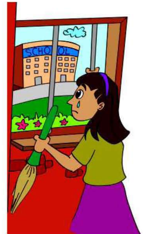
குழந்தை பள்ளிக்குச் செல்வதைத் தடுப்பது