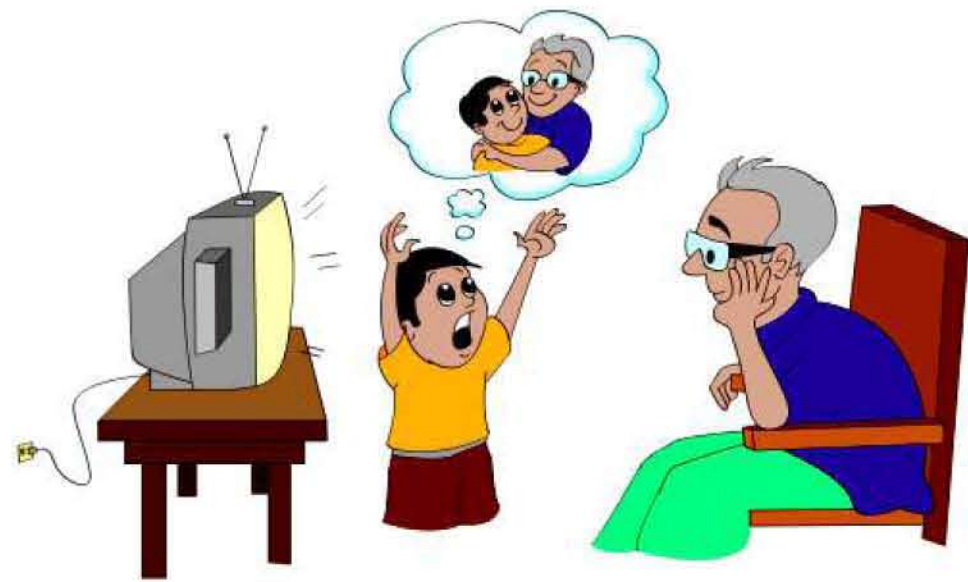
குழந்தையின் மன நலனை கண்டு கொள்ளாமல் இருப்பது