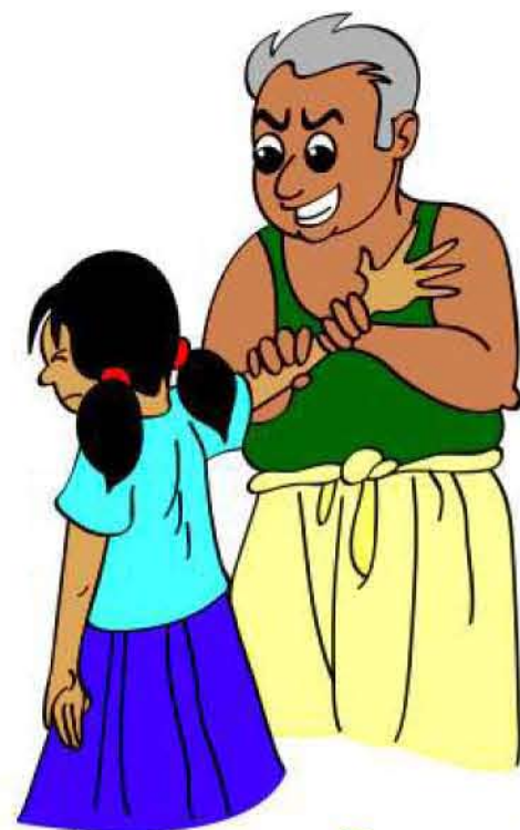
குழந்தையை தொடச் சொல்லி கட்டாயப்படுத்துவது