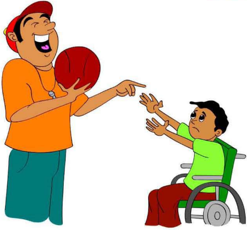
குழந்தையை ஏளனம் செய்வது