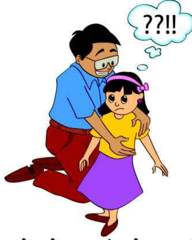
बच्चे को इस ढंग से छूना जिससे वो असहज, असुरक्षित या उलझन महसूस करे