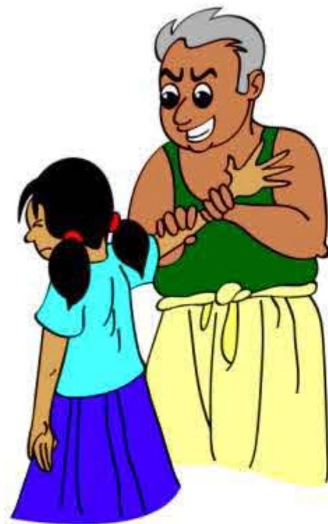
बच्चे को आपको छूने के लिए मजबूर करना