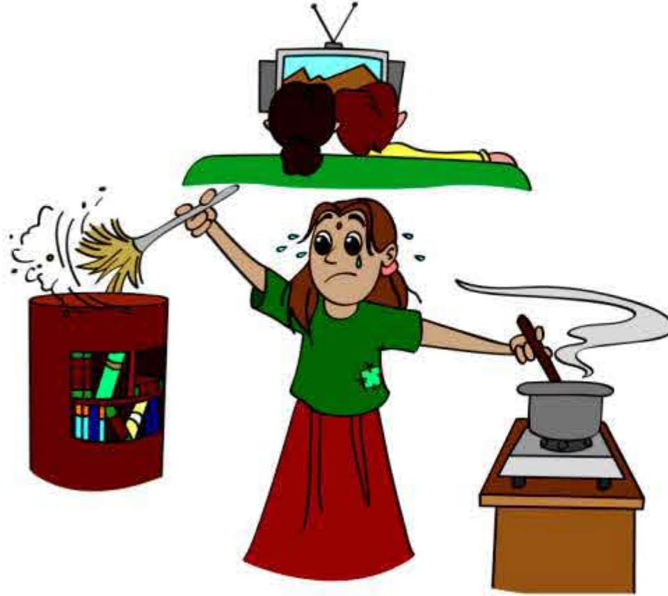
बच्चे को अपने घर में नौकर बनाकर रखना