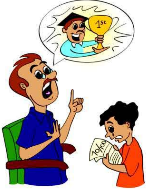
बड़ों की ज़रूरतों या अपेक्षाओं को पूरा करने के लिए बच्चे पर दबाव डालना