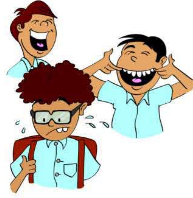
बच्चे का मज़ाक उड़ाना