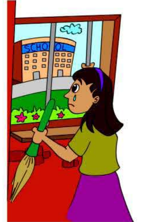
बच्चे को स्कूल ना जाने देना