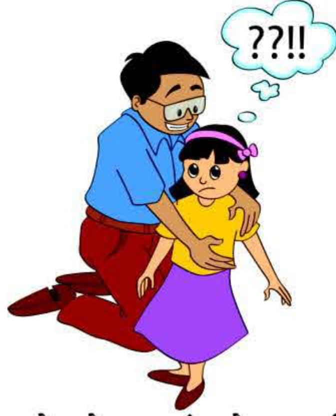
बच्चे को इस ढंग से छूना जिससे वो असहज, असुरक्षित या उलझन महसूस करे