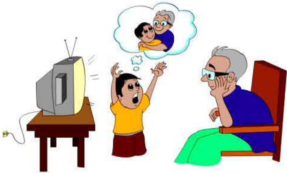
बच्चों की भावनात्मक सुरक्षा पर ध्यान न देना