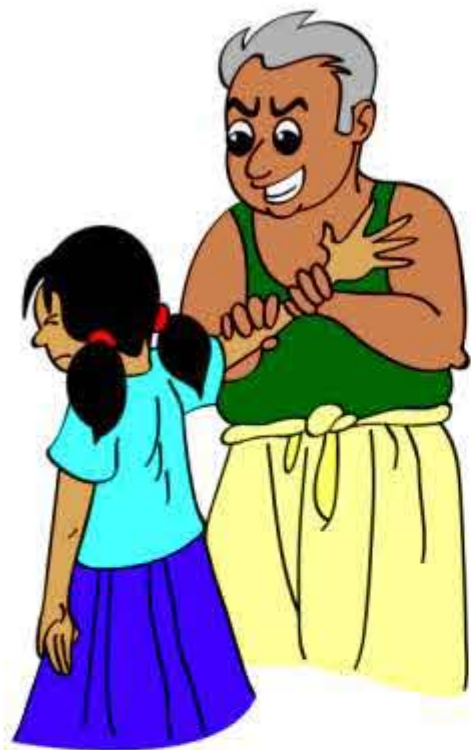
बच्चे को आपको छूने के लिए मजबूर करना