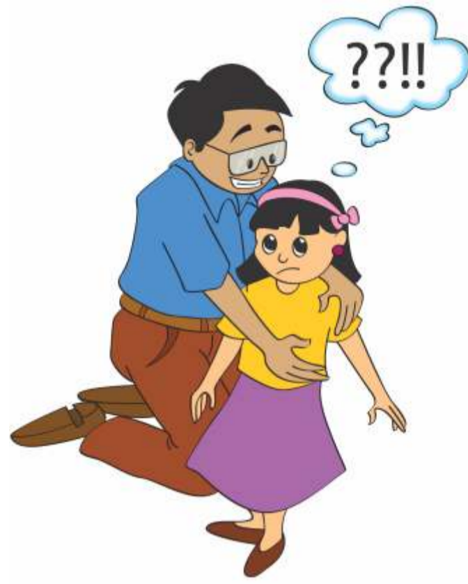
बच्चों को इस ढंग से छूना जिससे वे असहज, असुरक्षित या उलझन महसूस करें।