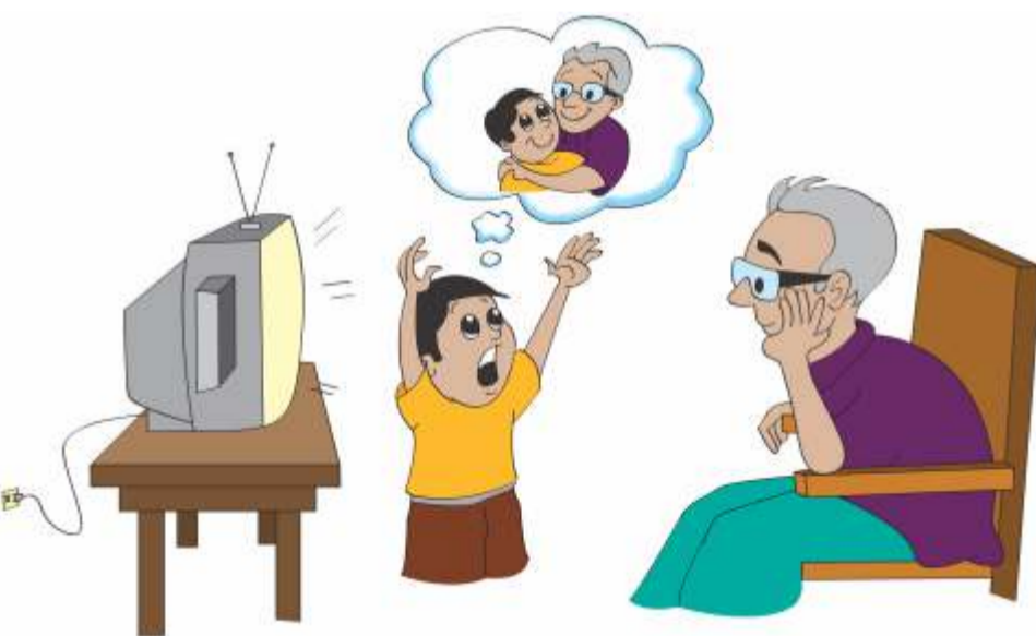
बच्चों की भावनात्मक सुरक्षा पर ध्यान न देना।