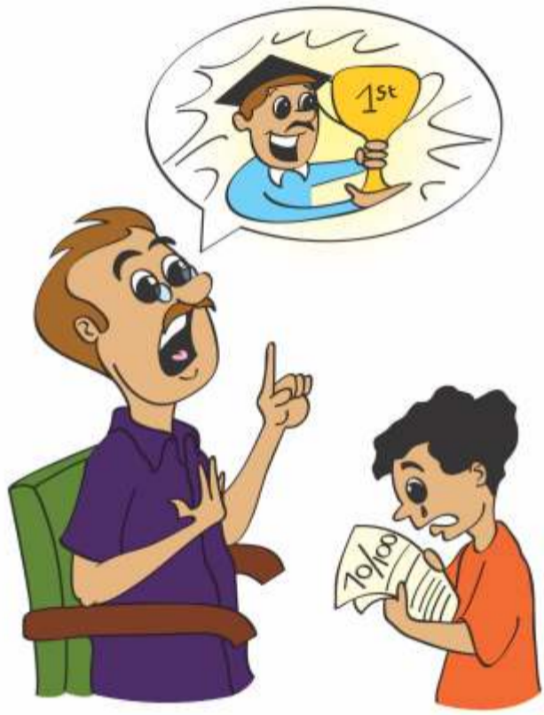
बड़ों की जरूरतों या अपेक्षाओं को पूरा करने के लिए बच्चे पर दबाव डालना।