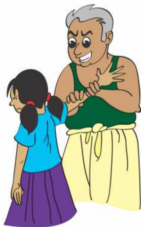
बच्चों को आपको छूने के लिए मजबूर करना।