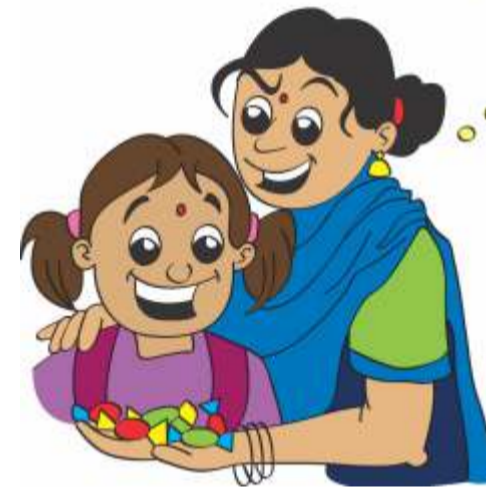
बच्चों से चालाकी करना।