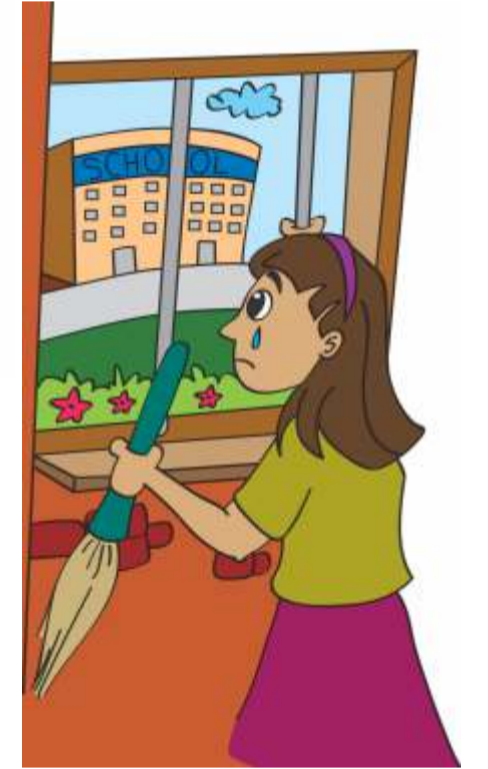
बच्चों को स्कूल न जाने देना।