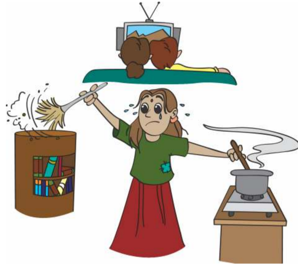
बच्चों को अपने घर में नौकर बना कर रखना।