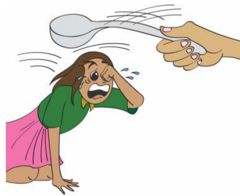
बच्चों को पीटना।