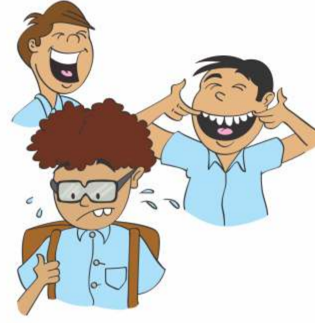
बच्चों का मजाक उड़ाना।