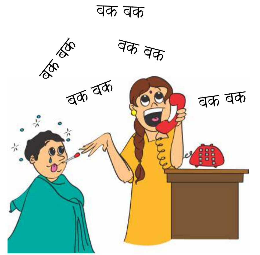
बच्चों के स्वास्थ्य की जरूरतों को अनदेखा करना।