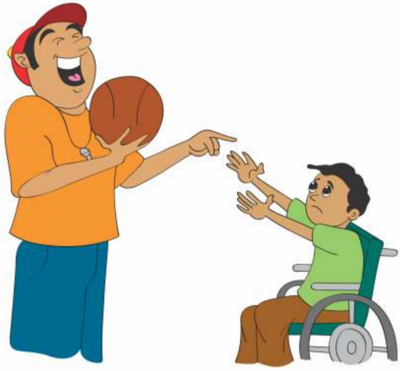
बच्चों का उपहास करना