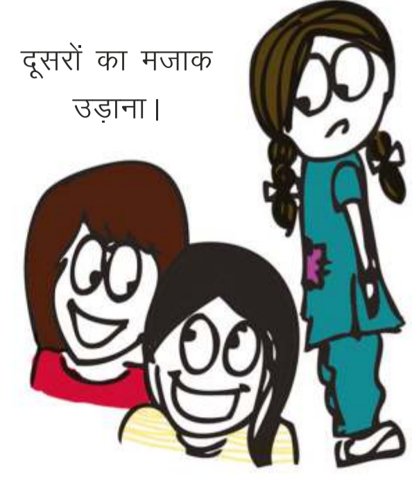
दूसरों का मजाक उड़ाना।