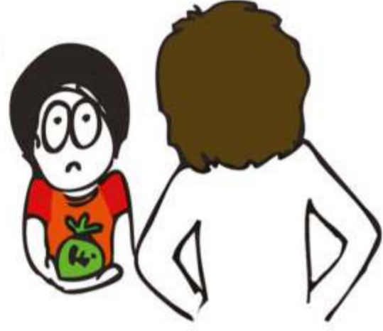
दूसरों की वस्तुएँ लेना या उनको नष्ट करना।

वे प्रायः उदासी, दुःख, गुस्सा, शर्मिंदगी, बैचेनी, अकेलेपन, चिंता और दुविधा का अनुभव करते हैं।