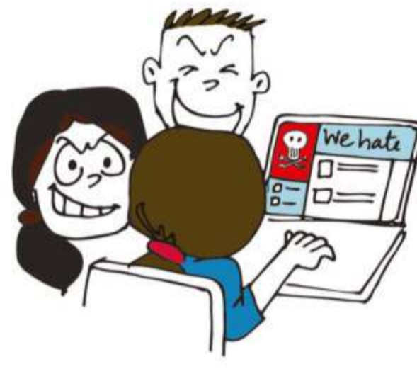
साइबर बदमाशी – आपत्तिजनक ईमेल एवं डडै भेजना।